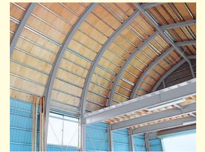
大容量の収納スペース 2階床