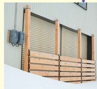
シャッター上雪囲い金具(木材は別注)