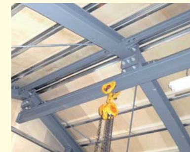
重量物の搬入に トローリーレール (チェーンブロックは別注)