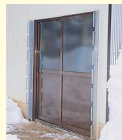
引違戸+雪囲い金具