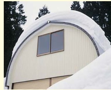
明かり取りに アルミ窓