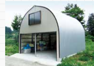
RH-3030型 (アルミ窓オプション)