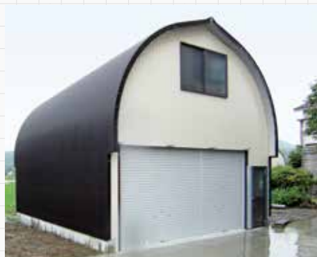
RH-3050-H型（ドアオプション）